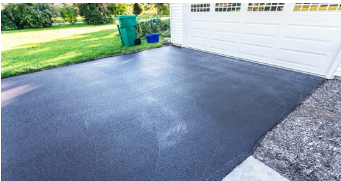
Concrete and Asphalt are common all-weather surface.

Any change from your current surfacing, or lack thereof, to a new type of surfacing requires a Zoning Clearance Permit.