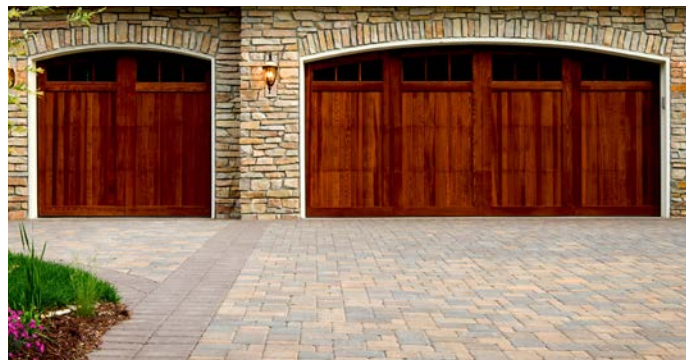
Brick and Concrete pavers may be used to form an all-weather surface in accordance with the Zoning Code.