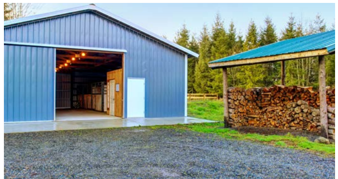
Gravel can be used as an all-weather parking if the surface was in place and in use prior to 1970.

Note: The non-conforming gravel driveway shall be maintained free of weeds, bare spots and large areas of grass that have grown through the gravel. Gravel driveways that are not maintained lose their non-conforming status and must be brought into compliance with the Zoning Code enacted on January 1, 2016.